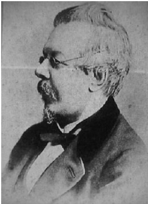
Dr. William Moon, izumitelj Moon sistema čitanja

Slijepim osobama nije lako, ali uz veliki uloženi trud i pomoć okoline uspijevaju ostvariti svoje ciljeve i ispuniti životne snove.